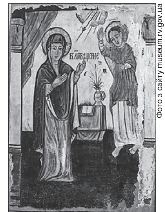
Особливе місце в музеї належить творам волинського іконопису

Нині тут працює небагуджий колектив, який сам творить новітню історію краю. Приміром, на «Музейні гостині», що вже відзначили чверть століття, до Рівного приїздили народні майстри з усієї України. А на початку жовтня в межах міжнародної конференції тут говоритимуть про інноваційні технології в музейній, архівній та бібліотечній справах її учасники з України та Польщі. Адже для сусідів-поляків інтерактивні музеї вже не новина, втім, облаштовують їх зазвичай за грантові кошти ЄС.